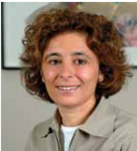
CLAUDIO GROSSMAN Dean, American University Washington College of Law

N OS COMPLACE ANUNCIAR EL PROGRAMA DE ESTUDIOS AVANZADOS EN Derechos Humanos y Derecho Internacional Humanitario de 2013 que se llevará a cabo del 28 de mayo al 14 de junio de 2013 en Washington, DC. El programa ofrecerá 19 cursos, 10 en inglés y 9 en español. Los cursos pueden ser tomados para obtener un Diploma, un Certificado de Asistencia o para créditos académicos.