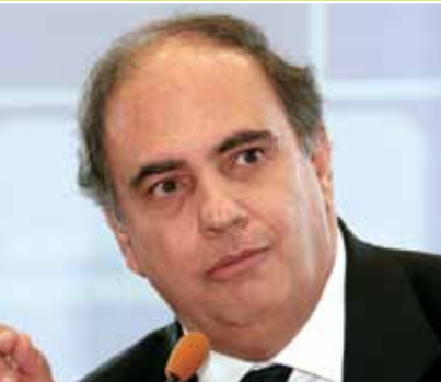
ANTÓNIO CANÇADO TRINDADE