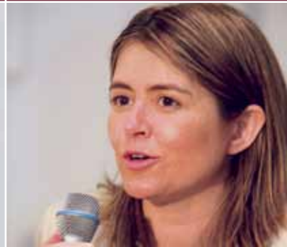
CATARINA DE ALBUQUERQUE